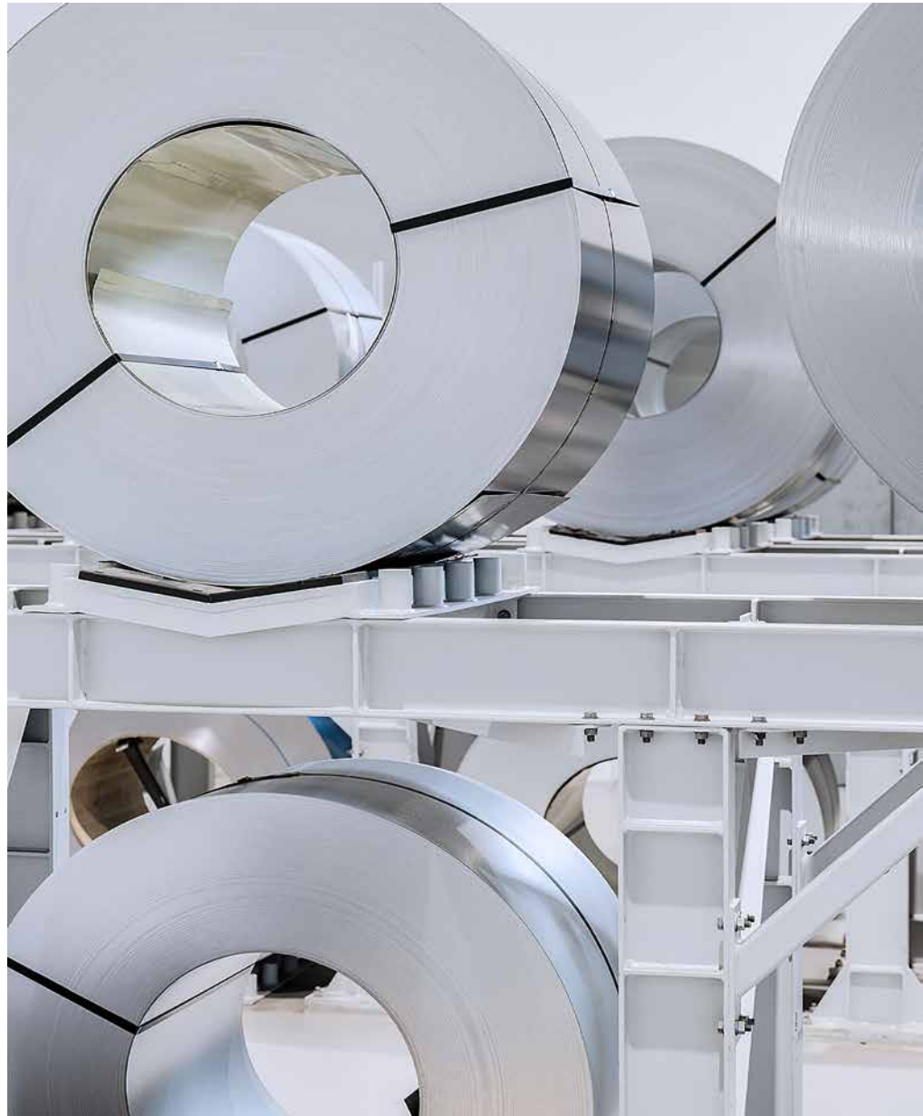
La production d'un nouveau four chez V-ZUG commence par de gros rouleaux d'acier.

dernier étage. C'est là que se trouve, sous un toit imposant, l'installation d'émaillage. Les composants, de plus en plus affinés au cours du processus de transformation sur les différents étages, sont ici chargés statiquement et ensuite pulvérisés avec de la poudre d'émail. Ils sont ensuite placés dans un four à 850 degrés, où l'émail fond de manière uniforme et plane, donnant à l'intérieur des fours son aspect typique, moucheté et doux.