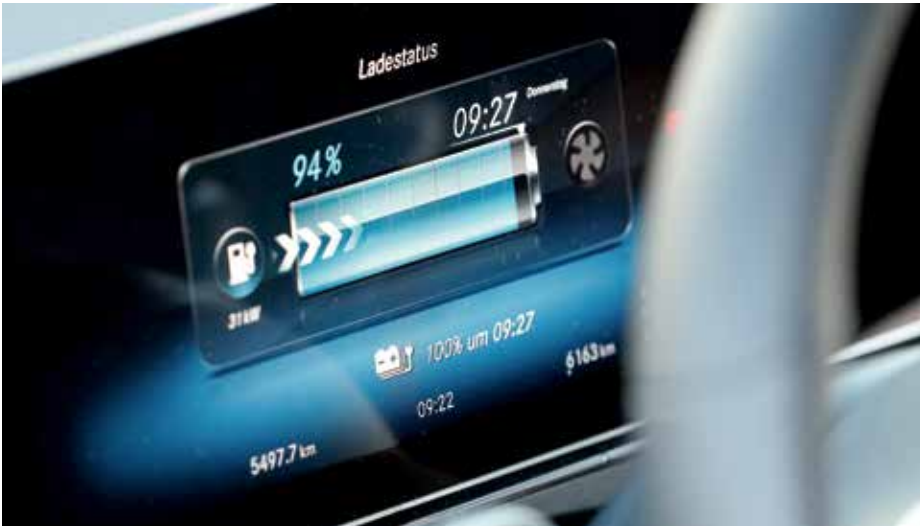
Neue «Welt»: Wer sich für ein Elektroauto entscheidet, muss umdenken.

Stromverbrauch sowie verfügbare Ladestationen mit ein. Das alles kann über das Smartphone gesteuert werden, inklusive Zugang zu Ladesäulen verschiedener Anbieter und der jeweiligen Bezahlung.