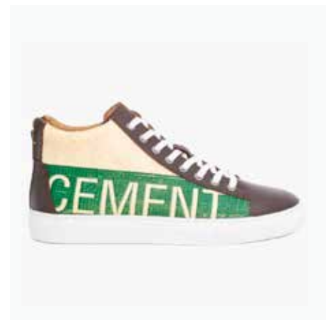
Recycling Sneaker High 18 Green Cement