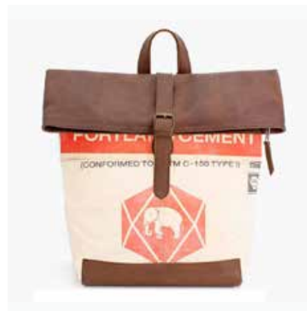
Recycling Rucksack Rolltop 19 Red Elephant