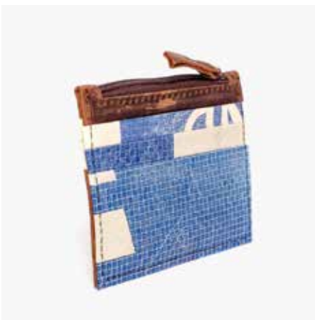
Recycling Credit Card Holder 19 Blue Full