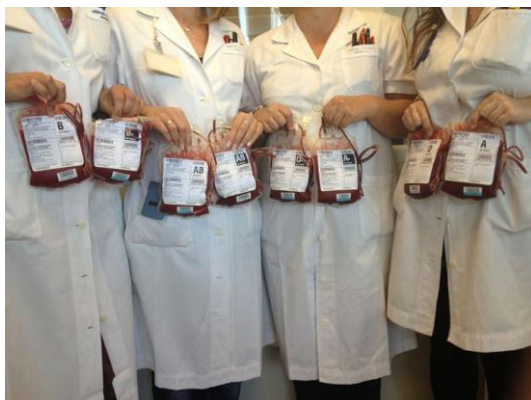
Foto preferita di Ted Scapa